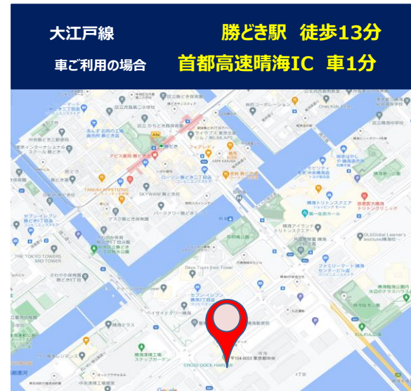
6階B面 シェアオフィス 配置図